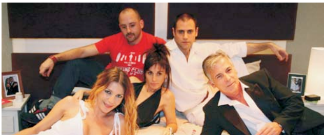
En la foto: el elenco junto a su director.